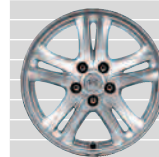
235/65 R17 Comfort Style