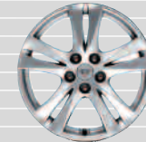
235/60 R18 Swiss Plus Edition Premium